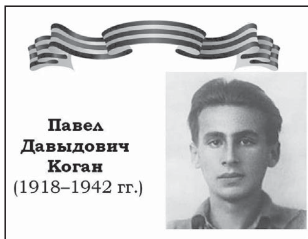
Павел Давыдович Коган (1918–1942 гг.)

Коган был блестящим знатоком поэзии, обладал недюжинной культурой стиха, но вкус у него не только не утонченный, но направленный прямо-таки в противоположную сторону, бог же (в которого он не верил) его явно «звал» и награждал чем-то вроде ясновидения, что и подтверждается