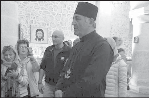
Из-за алиевской пропаганды «автохтонности азербайджанцев» в регионе Южного Кавказа удины вновь оказались в эпицентре внимания научной общественности.

Позиционируя себя в качестве прямых «потомков» кавказских албан, азербайджанская общественность пытается решить банальную задачу: путем искажения исторических и научных фактов доказать свое право на правопреимство, а именно, что азербайджанцы – прямые потомки народов Кавказской Албании, древнего государства, отличавшегося тесными политическими, культурными и духовными связями с Арменией. Более того, Кавказская Албания в течение длительного периода объективно оказывалась под влиянием ААЦ (Армянской Апостольской церкви). В 704–705 гг., после неудачной попытки албанского католика Нерсеса Бакура перейти в халкидонитство, церковь Албании потеряла автокефалию и вошла в состав армянской, а Албанская церковь превратилась в автономный католикосат Армянской церкви. Этот фактор впоследствии стал значимым в плане этнорелигиозных контактов кавказских албан и армян.