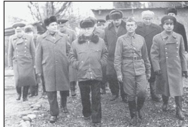
Главнокомандующий Сухопутными войсками генерал армии В. И. Петров (в центре) во время работы в частях 40-й армии.

Каждое утро в штабе 40-й армии начиналось с совещания («джирги», как его на афганский манер называли между собой офицеры). Обычно в 8.00 на ЦБУ оперативный дежурный, заместители командующего армией, начальники родов войск, служб докладывали командующему армией обстановку за сутки, разведывательную информацию, свои предложения по организации боевых действий. Затем командарм уточнял каждому задачу, давал указания. При этом он определял, реализацию какой развединформации берут на себя советские войска и какие силы надо задействовать афганцам.