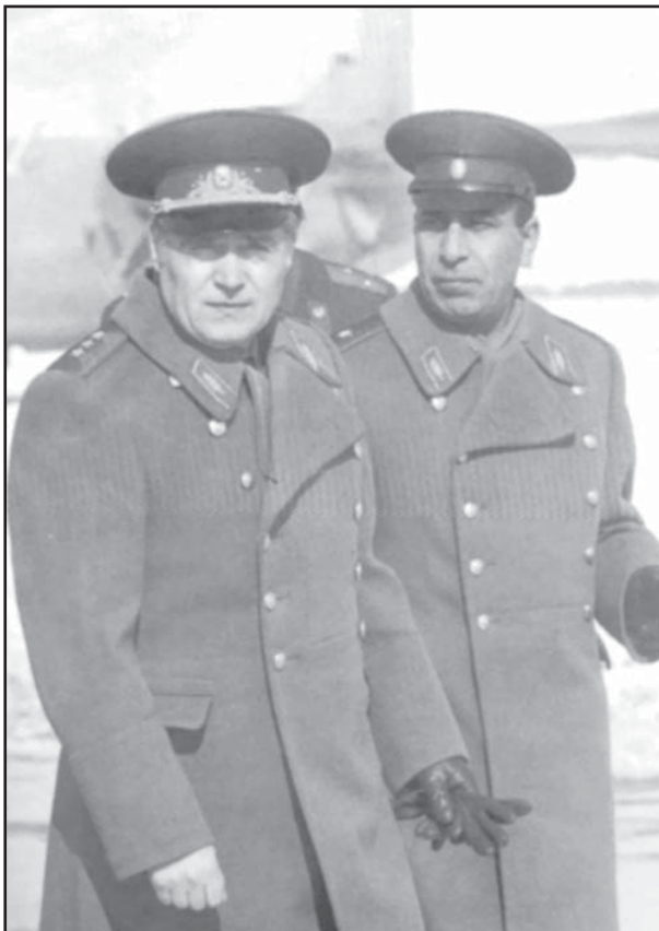
Командующий войсками ТуркВО генерал-полковник Ю. П. Максимов (слева).

... Расскажу о некоторых боевых операциях.