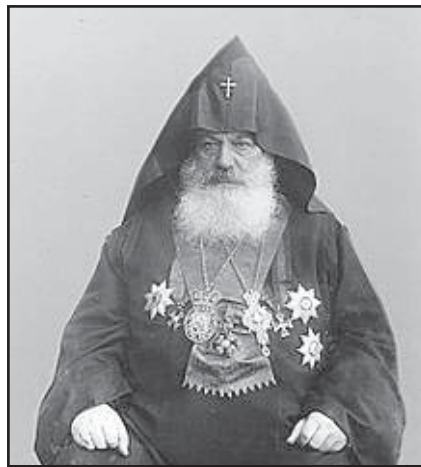
Геворг V Суренянц Тпхисеци, Католикос Всех Армян в 1912–1930 годах.

Военно-политический блок Антанта, а в первую очередь Россия в его составе, стремилась воспрепятствовать проникновению Германии в Османскую империю. Армянское население же империи продолжало оставаться в угнетенном состоянии и после прихода к власти младотурок в 1908 году.