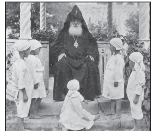
Католикос Геворг V Суренянц с армянскими сиротами, пережившими Геноцид.

В 1882 году Геворг Суренянц рукополагается в епископы. В 1886 году отправляется в Астрахань в качестве главы епархии. Затем в течение десяти лет ведет должность главы армянской епархии Грузии. В 1907 году он избирается местоблюстителем католикоса, а в 1912 году – Католикосом всех армян.