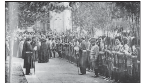
Католикос Геворг V Суренянц благословляет отряд добровольцев, 1918 год.

на два сектора, управление которыми передавалось двум иностранным Генеральным инспекторам, назначаемым с одобрения великих держав. Соглашение не предоставляло армянам тех широких прав автономии, которые были предусмотрены в русском проекте. Однако были обеспечены благоприятные условия для последующего освобождения Западной Армении.