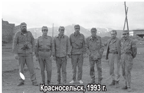
Красносельск, 1993 г.