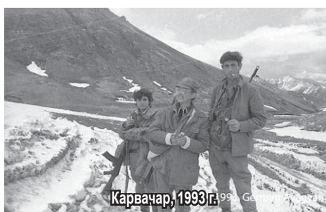
Карвачар, 1993 г.