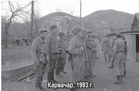
Карвачар, 1993 г.