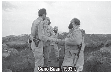
Село Ваан, 1993 г.