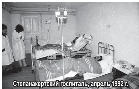
Степанакертский госпиталь, апрель 1992 г.