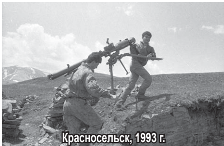
Красносельск, 1993 г.