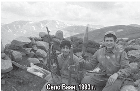
Село Ваан, 1993 г.