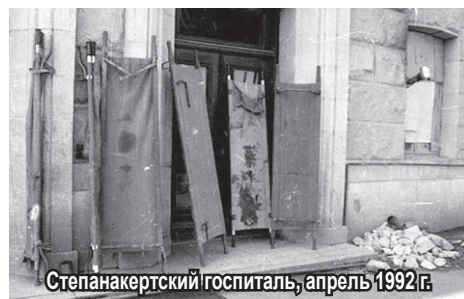
Степанакертский госпиталь, апрель 1992 г.