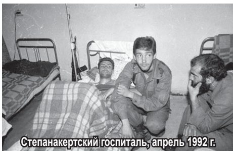
Степанакертский госпиталь, апрель 1992 г.