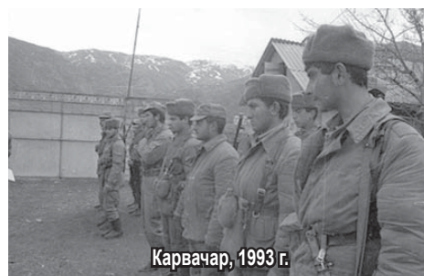
Карвачар, 1993 г.