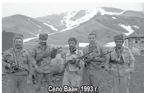
Село Ваан, 1993 г.