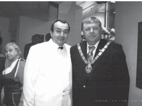
Ս. Ղ. Ղամբարյանը և Նոգինսկի մարզպետ Ա. Վ. Լապտևը: Երկու ժողովուրդների բարեկամությունը անասան է: